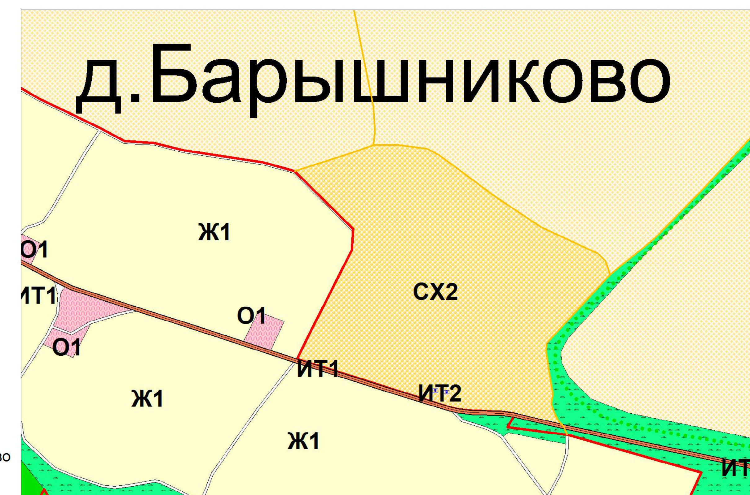
Фрагмент - д. Барышеиково (масштаб 1:5000)