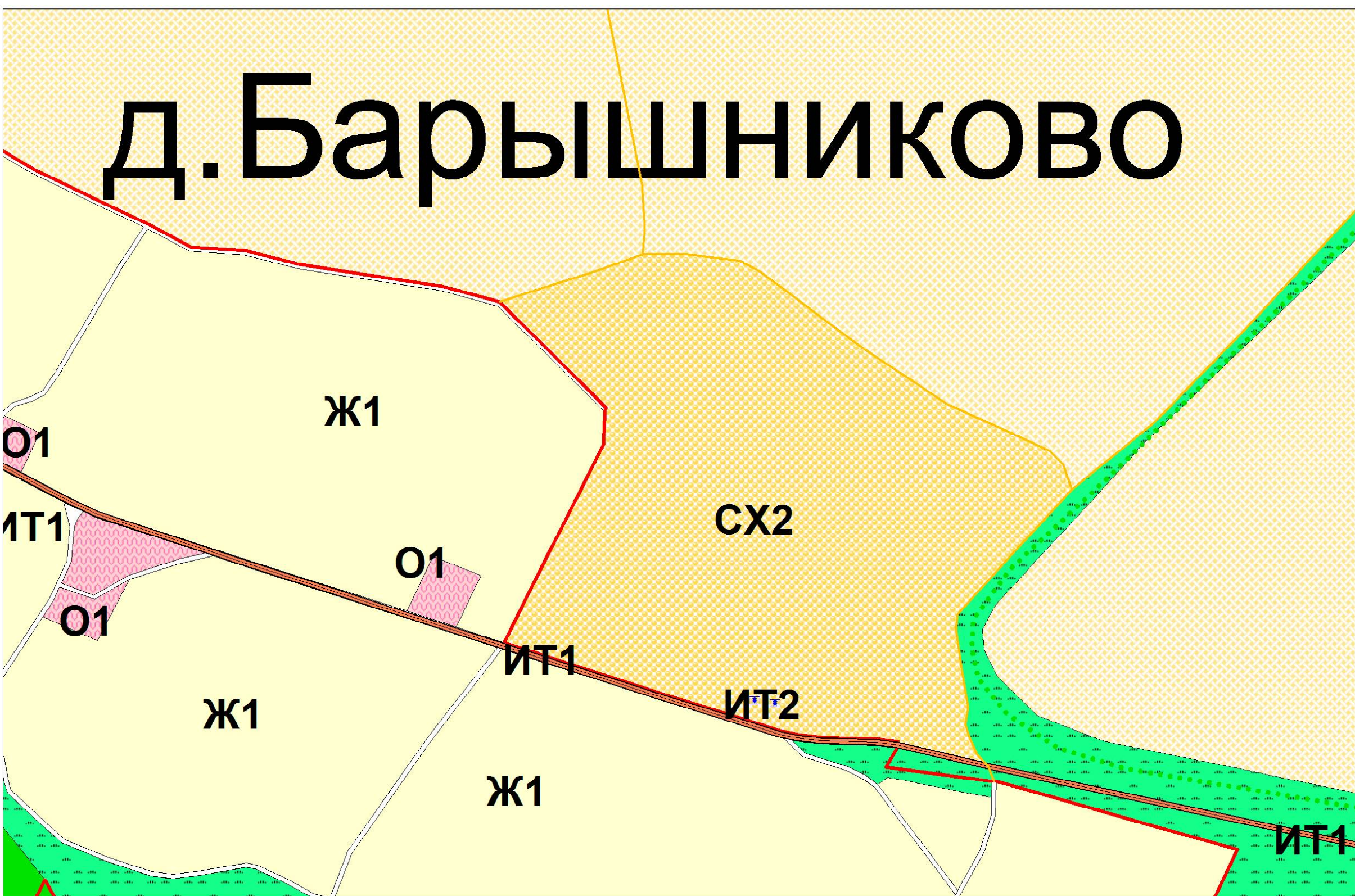
Фрагмент- д. Барышниково (масштаб 1:5000)