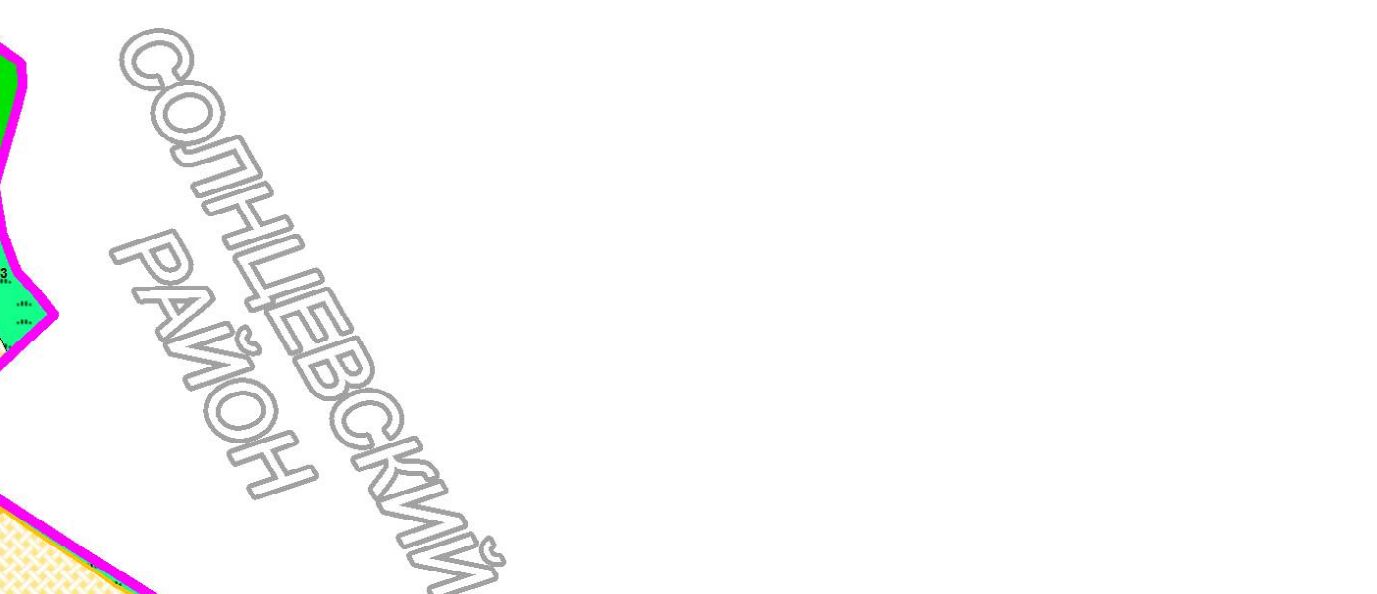
Фрагмент- д. Полевая (масштаб 1:5000)