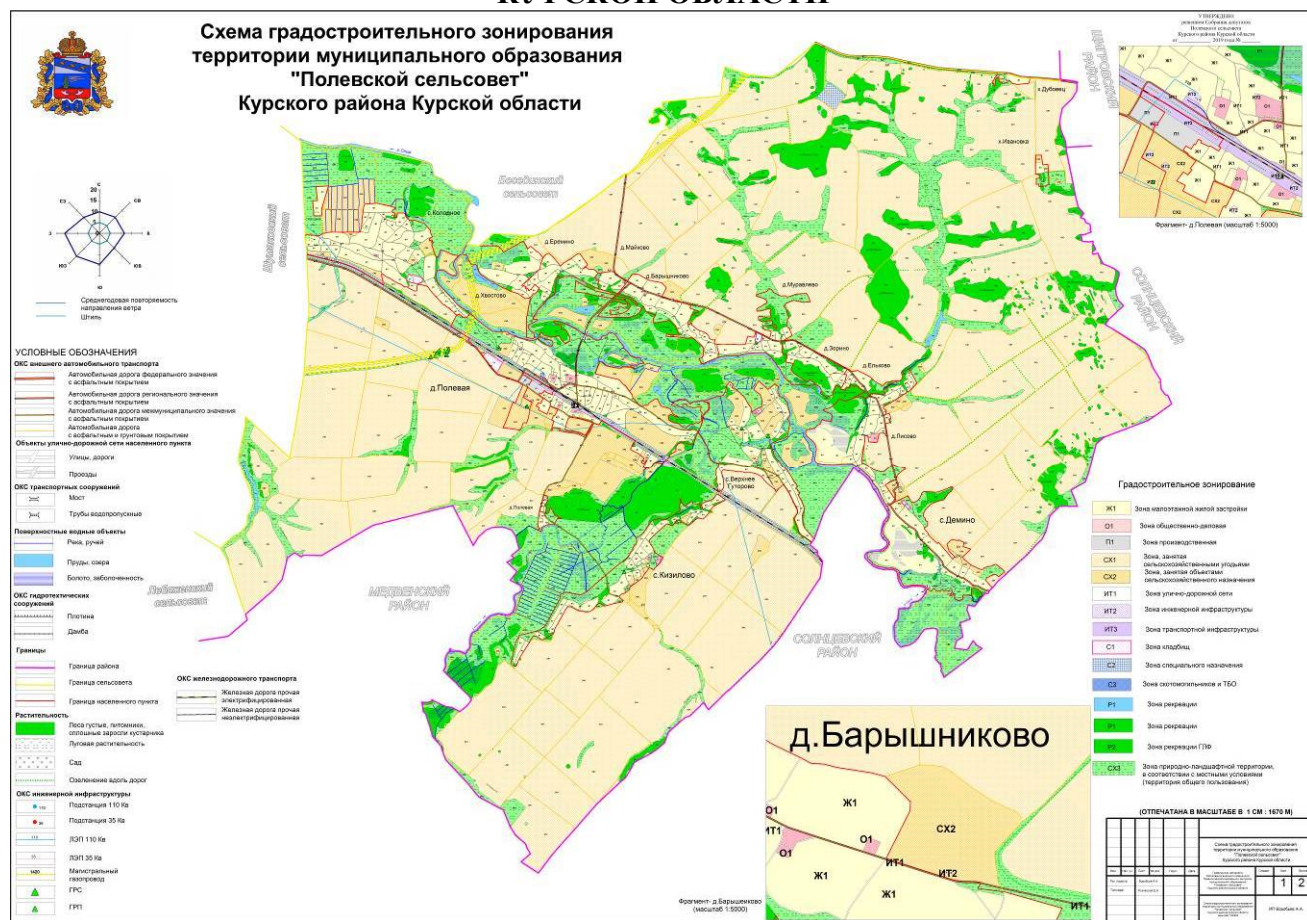
Рис.1. Схема градостроительного зонирования территории муниципального образования «Полевская сельсовет» Курского района Курской области